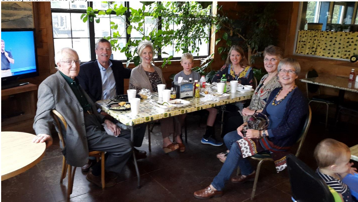
Sunday lunch with the family