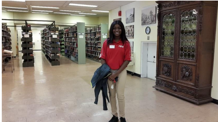
Receptie Shelton State Community College

Shelton State Community College te Tuscaloosa biedt diverse beroepsopleidingen aan, alsmede algemene cursussen. Ze beschikt over een uitstekende voorziening ter ondersteuning van studenten, centraal in het gebouw waar ook alle andere student services gesitueerd zijn. Deze zijn uiterst zichtbaar en prominent aanwezig.